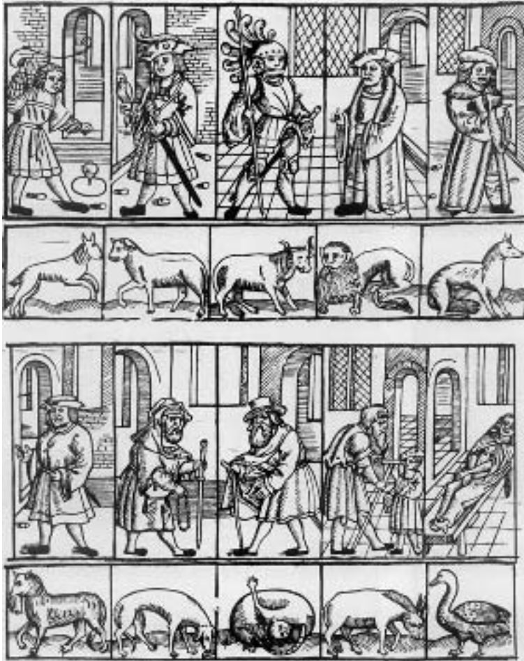
Abb. 2: Die zehn Lebensphasen (Holzschnitt, aus: Jan van Doesborch, Der Dieren Palley , Antwerpen 1520; »Der Palast der Tiere«). Nach einem im 15. und 16. Jh. in Mittel- und Westeuropa verbreiteten Motiv werden die zehn Lebensphasen des Mannes hier mit Tieren verglichen: Zum 10-jährigen, einem spielenden Kind, gehört ein junger, springender Bock. Der 20-jährige ist durch ein Schwert und einen Falken als kampflustig dargestellt; sein Tiersymbol ist das Kalb. Stier und Löwe bei den 30- und 40-jährigen vertreten die Kraft und Stärke der mittleren Jahre. Der Unfug treibende Fuchs bei dem 50-jährigen, der gefräßige Wolf bei dem 60-jährigen und die ihren After leckende Katze bei dem 80-jährigen sollen negative Eigenschaften Älterer zeigen (untere Reihe). Der 70-jährige – mit Stock und Rosenkranz – beginnt, an das Jenseits zu denken; er wird mit einem Hund verglichen, der einen Knochen abnagt. Der 90-jährige gleicht dem Esel und wird deshalb von Kindern verspottet. Der 100-jährige liegt schon tot auf der Bahre; der Tod verschlingt alles – wie die gestopfte Gans [35. 19–21].

Dante im Anschluss daran diese Bewegung als einen symmetrischen Bogen beschrieben, »der von der Erde zum Himmel aufsteigt bis zum Kulminationspunkt, von dem aus er wieder absteigt«; der Zenit des Lebens werde mit 35 Jahren erreicht [13. 34]; [63. 103].