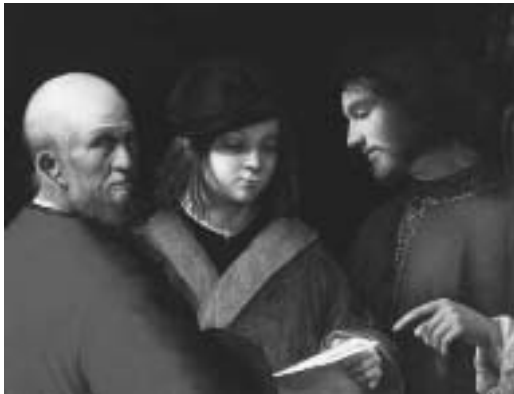
Abb. 1: Giorgione, Die drei Lebensalter (Öl auf Holz, um 1520). Das Bild zeigt einen jungen Mann mit einem Notenblatt in der Hand als Lernenden, einen Erwachsenen als Lehrenden und einen Greis, der am Geschehen teilnimmt, zugleich aber seinen skeptischen Blick auf die Welt richtet. Giorgione setzte sich immer wieder mit dem Lebenslauf auseinander. Auf dem Gemälde Drei Philosophen (um 1508) z. B. vertreten die drei männlichen Lebensalter (bis heute nicht gänzlich geklärte) symbolische Funktionen [29.84].

In der medizinischen Literatur der Nz. und insbes. in der 7Diätetik galt eine maßvolle, arbeitssame und disziplinierte Lebensführung von Jugend an als Voraussetzung eines langen Lebens und gesunden Alters – eine Auffassung, die zur Mitte des 19. Jh.s mit den neuen bürgerlichen Werten harmonierte [16.123]. Bedürfnisse, über den gesamten L. Bilanz zu ziehen, fanden auch in 7Autobiographien Ausdruck, ebenso im Genre der 7Leichenpredigt, in denen Ph. des familialen, beruflichen und öffentlichen Lebens der Verstorbenen gewürdigt wurden [20].