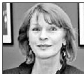
Senta Berger schaut nicht mehr gerne in den Spiegel, ...